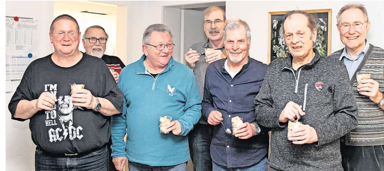
Gemeinsam schnippeln, essen und plauschen – das zubereitete Mahl ist für die Witwer ein wöchentlicher Höhepunkt.

mit Witwern“ ist ein Ausweg aus der Einsamkeit