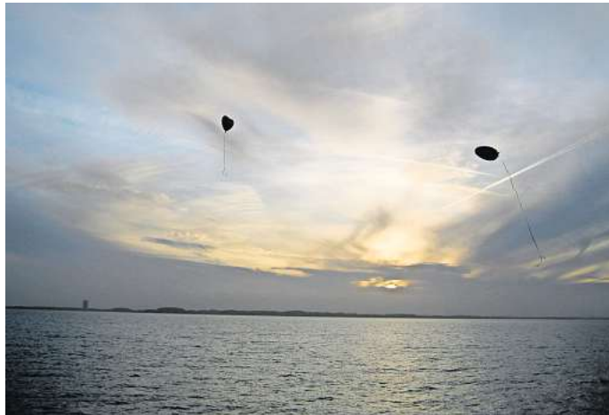
Wer vorsorgt, kann selbst bestimmen, wie er bestattet werden möchte.

Wer einen Todesfall erfährt, ist in einer emotionalen Ausnahmesituation. Hopp und seine Mitarbeiter übernehmen alle formalen und organisatorischen Schritte. Mit einer Bestattungsvorsorge kann der Vorsorgende zudem genau regeln, wie er sich seine eigene Bestattung vorstellt. Es kostet aber Überwindung, die Bestattung zu thematisieren. „Doch ich stelle immer wieder fest: Später sind sogar die Angehörigen erleichtert, wenn zuvor schon alles geregelt wurde“, sagt Hopp. Durch das Treuhandkonto ist das Geld auch im Fall einer Insolvenz gesichert.