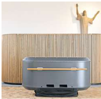
Das Pilotprojekt Reerdigung ist in Mölln angelaufen: Im Vordergrund der Kokon, dahinter die Wabe für die Transformation. . Foto: Sven Krieger

„Die Reerdigung ist eine natürliche ökologische