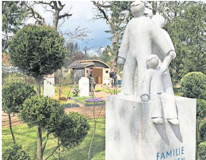
Grabsteine können viel über ein Leben aussagen.

Es geht bei einem Todesfall auch immer um Erinnerungen und dafür ist ein Grabstein wichtig. „Am Grab kann ich trauern, den Stein berühren, Zwiesprache halten. Der Ort der Trauer ist visualisiert und ich darf die Trauer zurücklassen, wenn ich die Grabstelle ver-