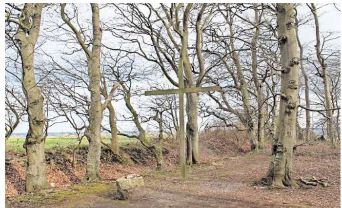
Als Ausgangspunkt einer Trauerzeremonie kann der Andachtsplatz dienen.