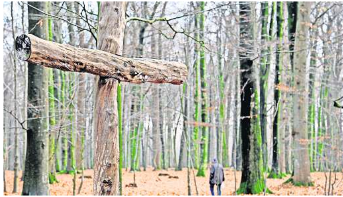
Der Wald ist immer ein besonderer Ort – auch für Bestattungen.