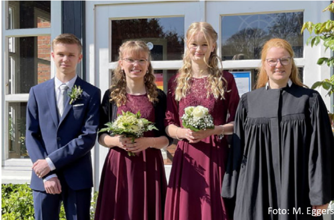
Konfirmation am 30.04.2022 um 11:00 Uhr