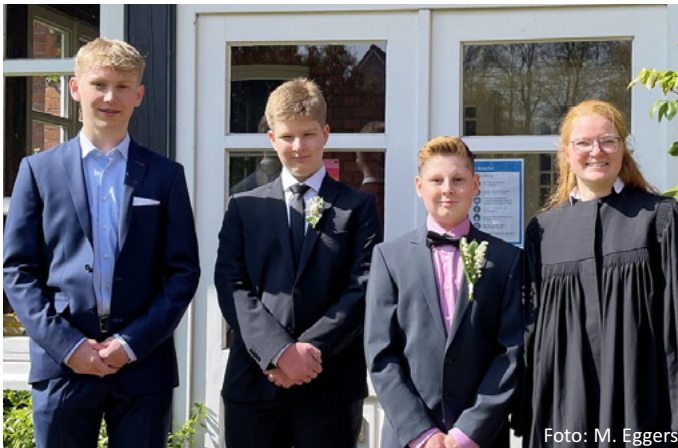
Konfirmation am 01.05.2022 um 11:30 Uhr