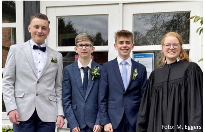
Konfirmation am 01.05.2022 um 09:30 Uhr